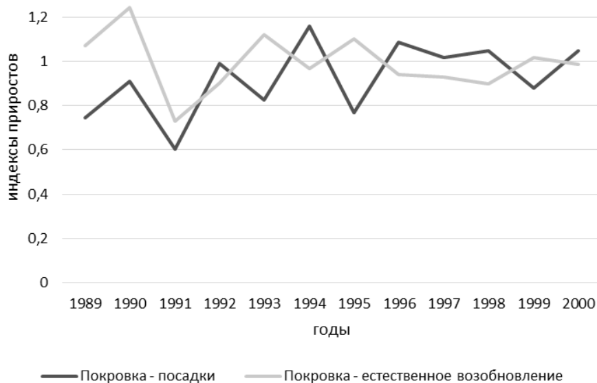
Рисунок 3. Динамика индексов линейного прироста естественного возобновления P. sylvestris на экополигоне «Покровка»

Данные выводы подтверждаются и при визуальном анализе графиков индексированных линейных приростов – динамика хода роста у лесокультур и естественных древостоев на одном и тот же участке различается (рис. 1).