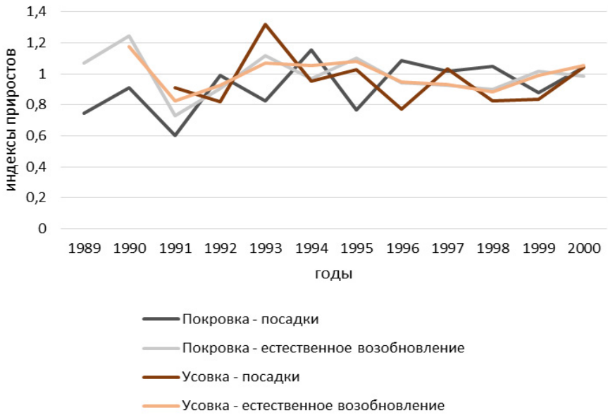
Рисунок 1. Динамика индексов линейного прироста Pinus sylvestris L. на экополигонах «Покровка» и «Усовка» («Междуречье»)

В ходе корреляционного анализа рядов индексов прироста обнаружены значимые коэффициенты корреляции ( p=95\% ) для естественных древостоев экополигонов «Покровка» и «Усовка». Между рядами приростов лесокультур и естественных древостоев на одних и тех же участках, а также между лесокультурами на различных участках значимых взаимосвязей обнаружено не было. Таким образом, можно констатировать сходство рядов приростов естественных древостоев между собой и несходство их с лесокультурами.