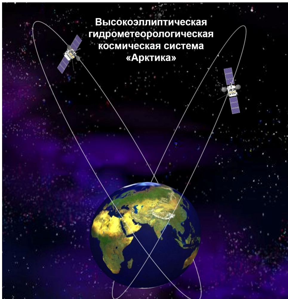
Рисунок 2. Орбитальное построение высокоэллиптической гидрометеорологической космической системы «Арктика-М»

Одно из значимых достижений научно-организационной деятельности В.В. Асмуса последних лет – разработка по его инициативе и при непосредственном участии крупного инновационного проекта по созданию системы метеоспутников на высокоэллиптических орбитах серии Арктика-М. Ее орбитальное построение представлено на рис. 2.