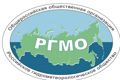
Рисунок 3. Логотип Общероссийской общественной организации «Российское гидрометеорологическое общество»

На этом посту приложил много усилий по развитию деятельности общества, популяризации службы и привлечению молодых специалистов. Ее логотип представлен на рис. 3.